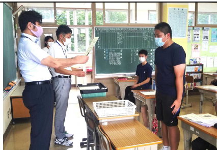
*交流試合「健闘を讃える賞」を受け取る3年生

生徒には各学年から、夏休みの学習や生活の様子を記録できるよう、「夏休みのしおり」を配付しています。記入状況なども時々ご覧いただき、励ます材料としていただきたいと思います。