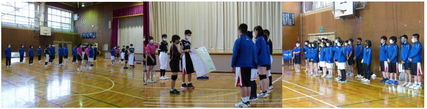
【1・2年生からメッセージを代表で受け取る各部の部長さんと全校生徒】