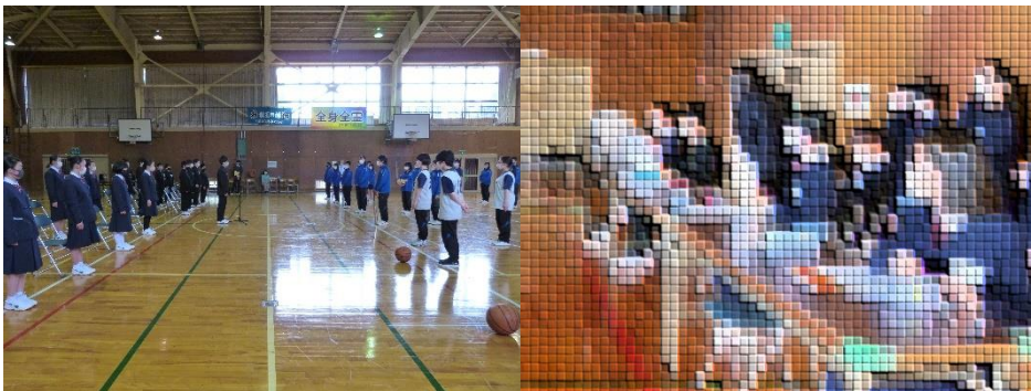
先輩らしい姿が見られた新入生を迎える会 4/13