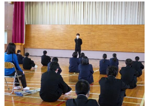
今年度初めての心の集会 4/28