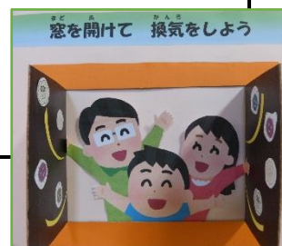
保健室前掲示板から (I先生作)

新型コロナウイルス感染症の再拡大に伴い、第2学年を対象に1月31日に予定しておりました仙台市での福祉体験学習を 延期 とさせていただきます。今後も行事等の変更が出てくる可能性があります。 マチコミメール 等でご連絡をさせていただきますので、定期的にメールをご確認くださいようお願いいたします。