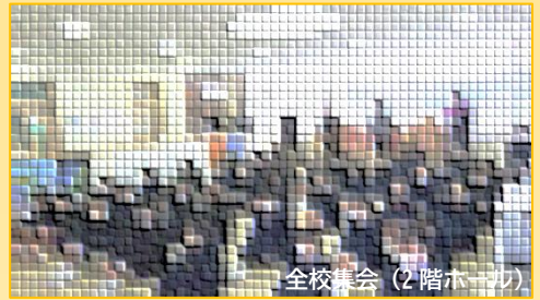
全校集会 (2 階ホール)

冬休み明けの全校集会在本日1校時に行われました。集会の中で、各学年及び生徒会から4名の生徒が全校生徒を代表して新年の抱負を述べました。休み中にしっかりと発表原稿を準備し、自分の言葉で堂々と発表する姿はとても頼もしいものでした。新たな年を良い年にするべく「頑張るぞ!」という思いをみんなで共有できた時間でした。それぞれが立てた目標を大切にして、一年間みんなで励まし合って、助け合って学校生活を送ってくれることを願っています。